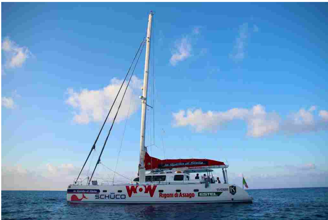
Lo Spirito di Stella

Lignano Sabbiadoro. Sarà il porto di una delle più rinomate località turistiche dell'Adriatico a fare da campo base per la nuova edizione del progetto WoW - Wheels On Waves. Dopo aver attraversato l'Atlantico ospitando oltre venti equipaggi da tutto il mondo con l'edizione d'esordio del 2017 e fatto un doppio giro d'Italia l'anno successivo, il progetto di inclusione sociale della Onlus Lo Spirito di Stella giunge alla sua terza edizione con l'intenzione di continuare a inseguire il sogno di universalità, inclusione e aggregazione per tutti.